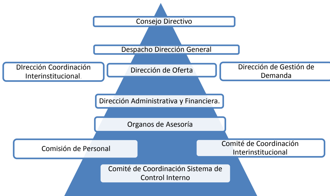
Esquema 2: Organización Agencia de Cooperación Internacional APC-Colombia. Elaboración propia con base en Decreto 4152 de 2011.